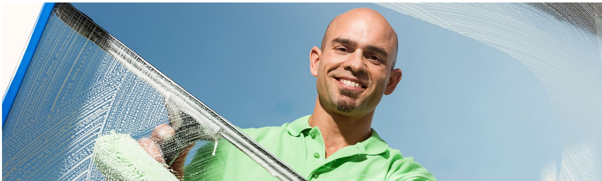
Klarheit mit einem Wisch

Auch bei Einsätzen mit erhöhtem Gefährdungspotential, wie etwa an Hochhäusern oder auf Dächern, können Sie sich auf das Geschick und das Know-how unseres Personals verlassen. Denn die Sicherheit unserer Mitarbeiter liegt uns selbstverständlich sehr am Herzen.