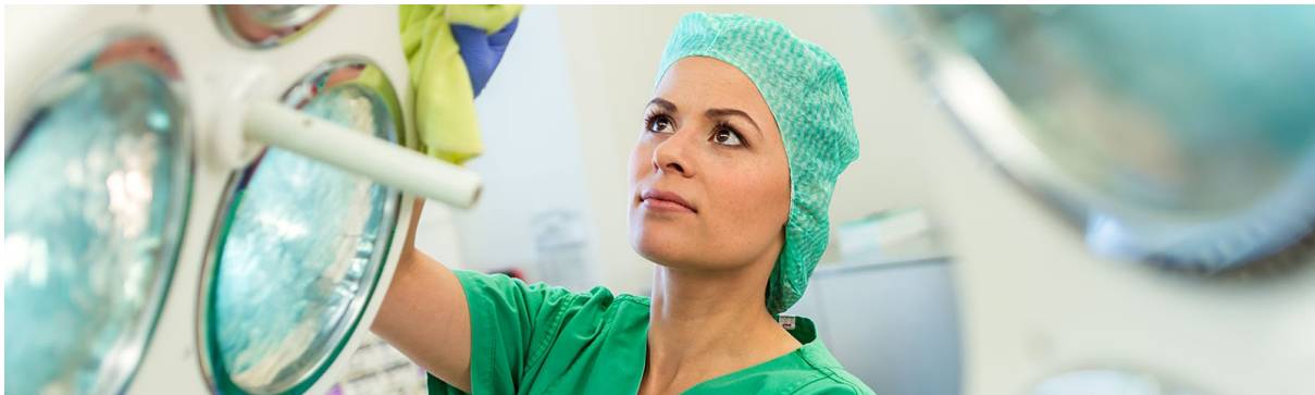
Hygiene und Desinfektion an erster Stelle

Als Hannovers dienstältester Reinigungsservice haben wir bei Schmalstieg uns der Hygiene verpflichtet. Unsere staatlich geprüften Desinfektoren bieten Ihnen neben der ebenso gründlichen wie diskreten Reinigung und Desinfektion Ihrer Liegenschaften auch umfangreiche Beratung und Schulungen auf diesem Gebiet an. So ist unser Hygieneservice nachhaltig, auf Ihre Bedürfnisse angepasst und zuverlässig.